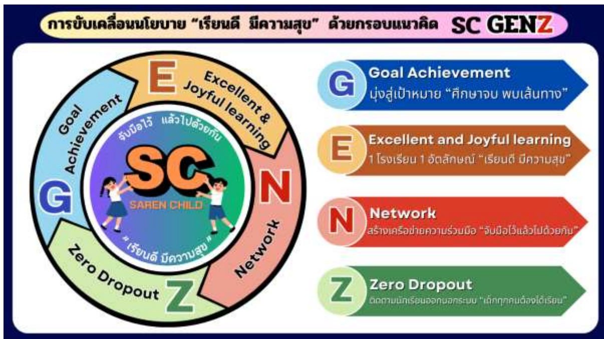
ภาพที่ 1 การขับเคลื่อนนโยบาย “เรียนดี มีความสุข” ด้วยกรอบแนวคิด SC GENZ

Z คือ Zero Dropout : ติดตามนักเรียนออกนอกระบบ “เด็กทุกคนต้องได้เรียน”